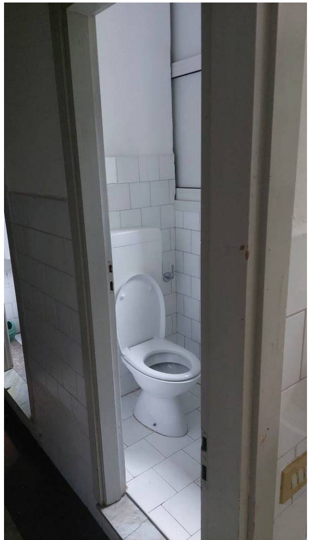
Servizi Igienici esistenti