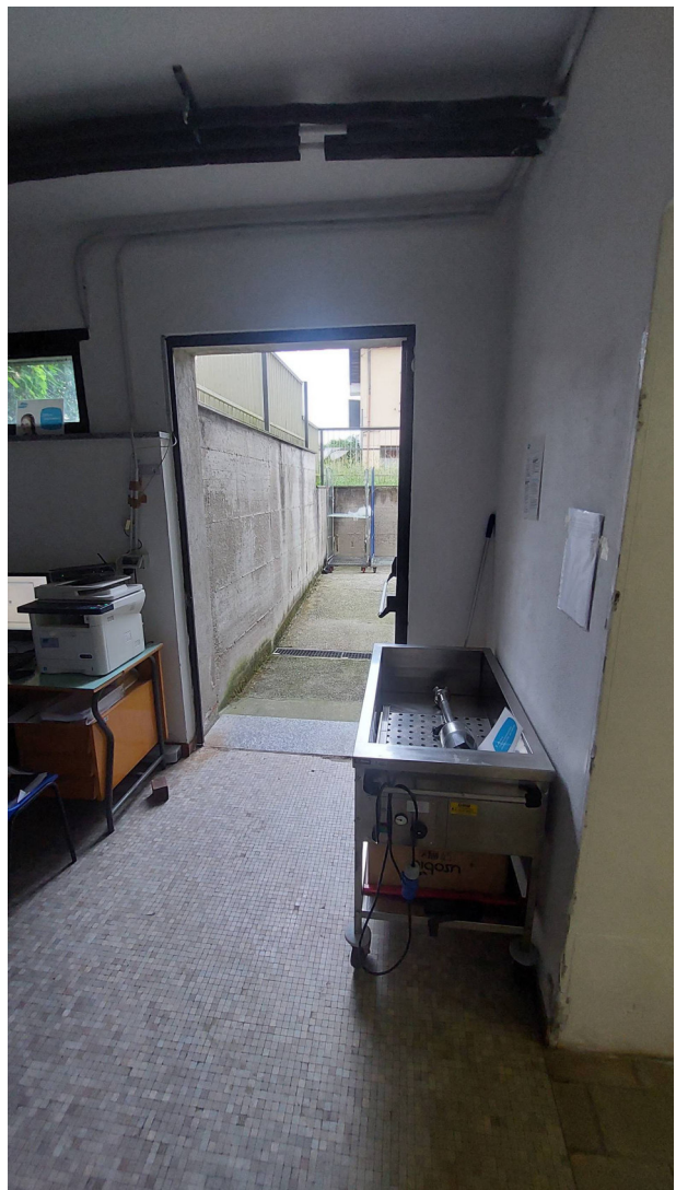
Sala distribuzione e uscita su rampa di servizio esistente