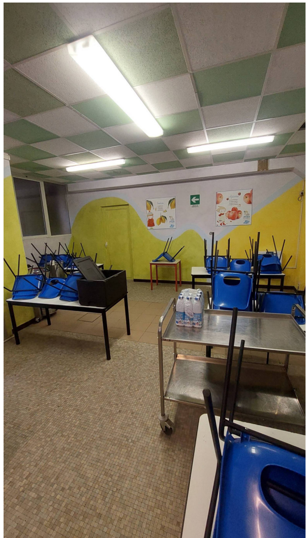
Sala refettorio e controsoffitto esistente