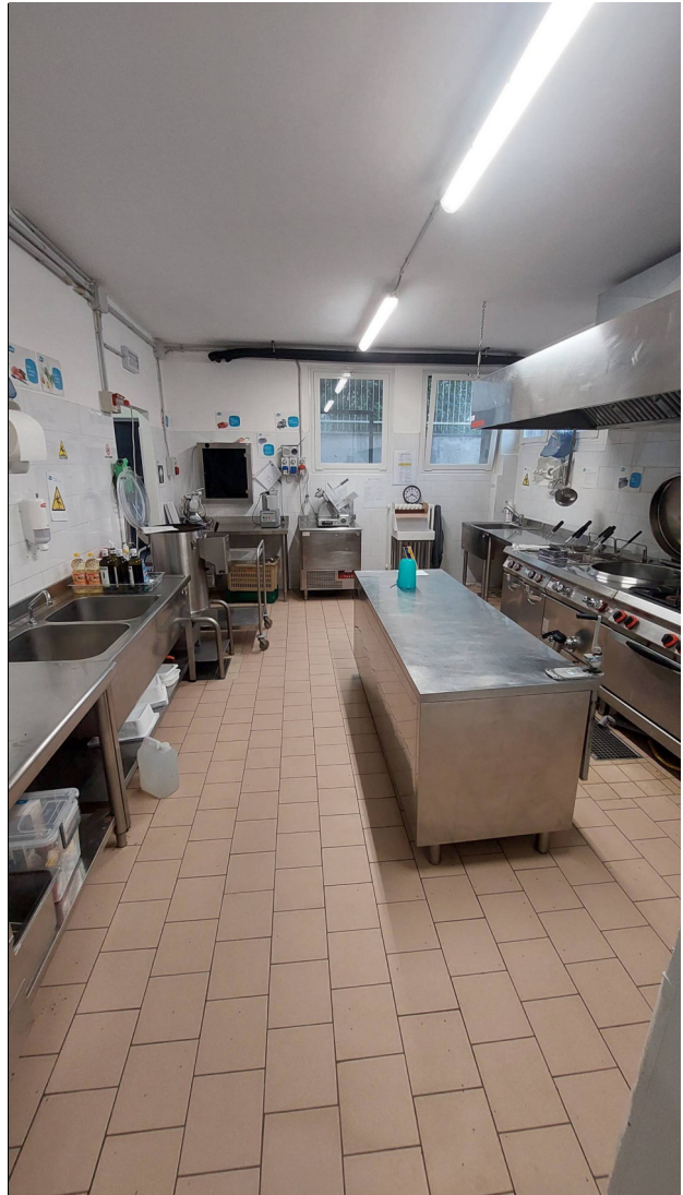
Cucina e area lavaggio esistenti